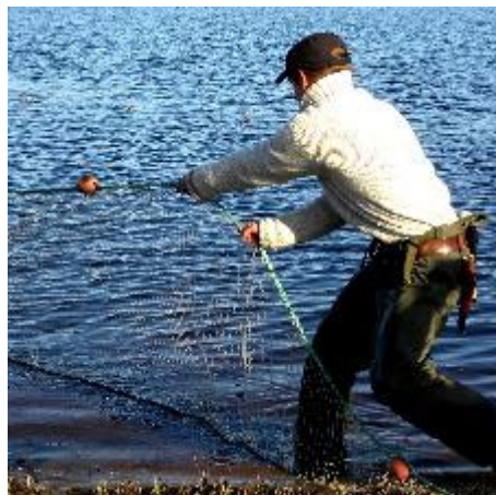
Kalastus ja pyydysrakennus